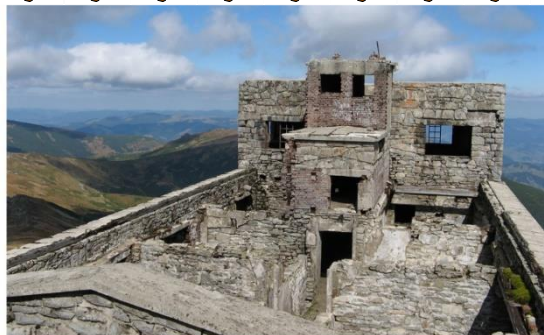
Вид на основний корпус з верхівки ротонди

Макет обсер- ваторії в Музеї мініатюр м.Яремче