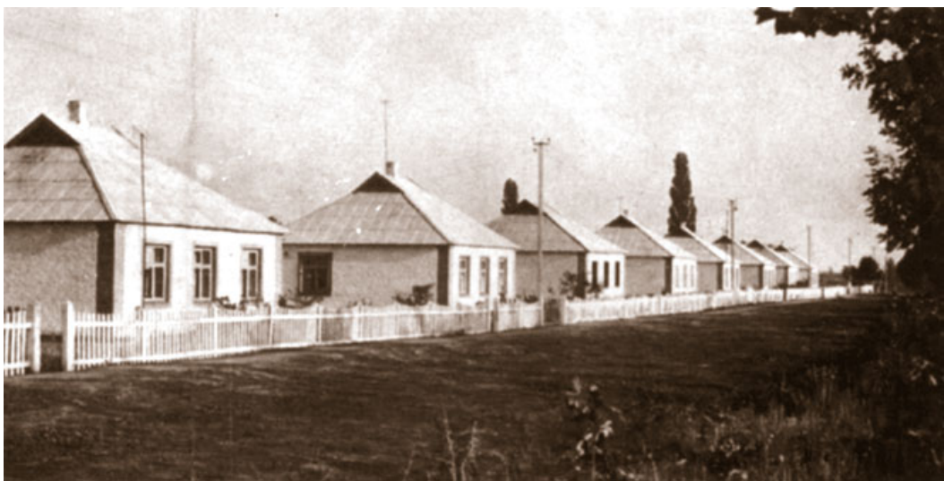
Нові будинки, с. Солониця, Лубенський район Полтавська область, 1970-ті рр.