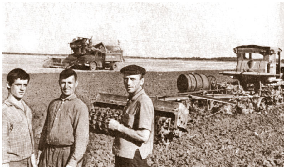
Механізатори колгоспу імені Тараса Шевченка, Диканьський район, Полтавська область

Режим доступу: http://history-poltava.org.ua/?p=14716