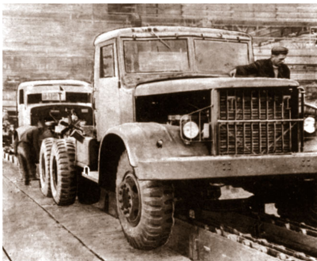
Конвеєр кінцевої продукції, Кременчуцький автомобільний завод, Полтавська область