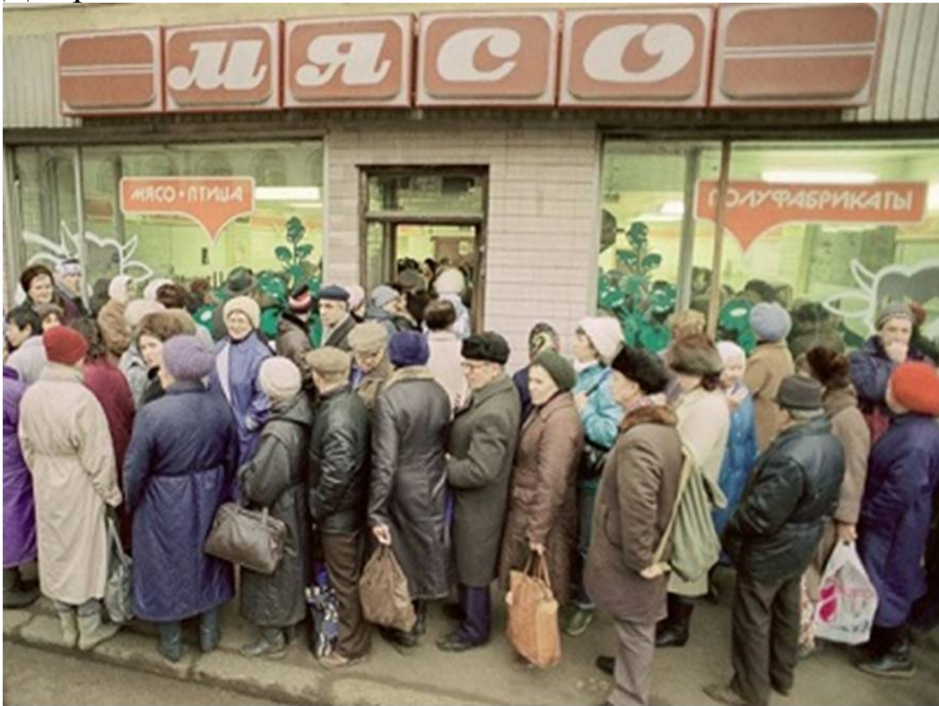
Черга – середовище буття радянської людини

https://www.google.com/url?sa=i&url=https%3A%2F%2Fargumentua.com%2Fstati%2Fsrpr-pristrast-zakovbasoyu&psig=AOvVaw1pa4M0-J1ooaWpZ5259Xy8&ust=1746807526607000&source=images&cd=vfe&opi=89978449&ved=0CBEQjRxqFwoTCIjp4KijlI0DFQAAAAAdAAAAABAm