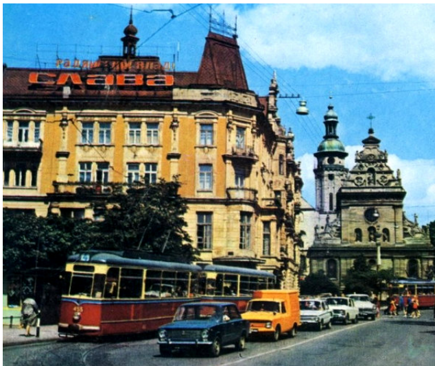
Історичний центр, м. Львів, 1970-ті рр. Режим доступу: http://istpravda.com.ua/research/2011/04/13/35736/view_print/