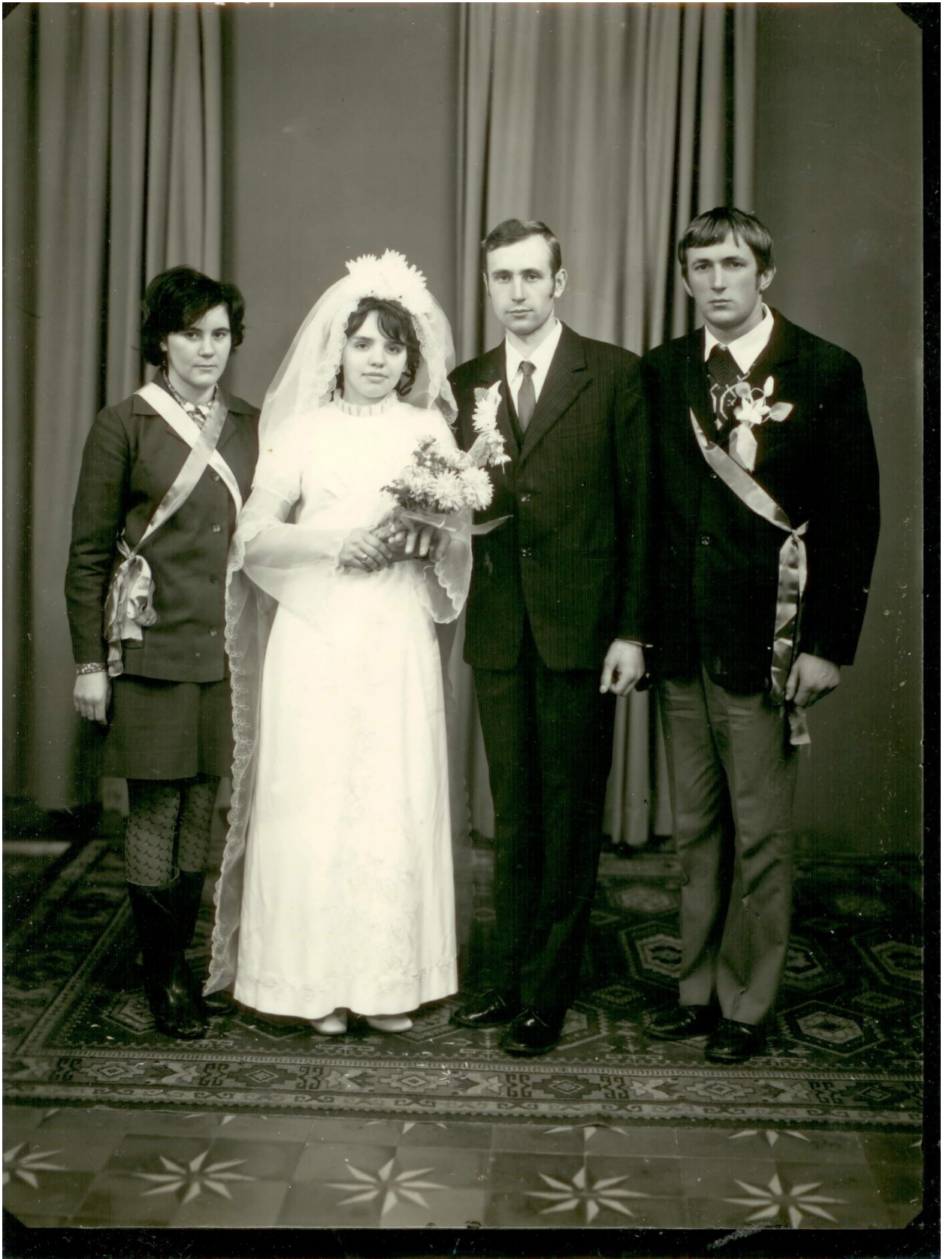
Пам'ятне фото із фотоательє .