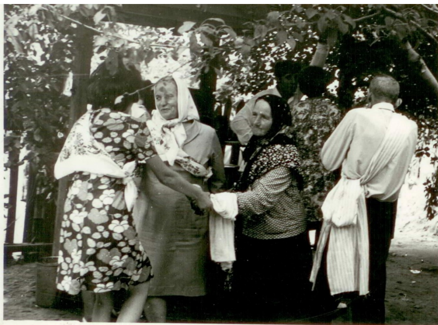
Традиції сільського весілля.