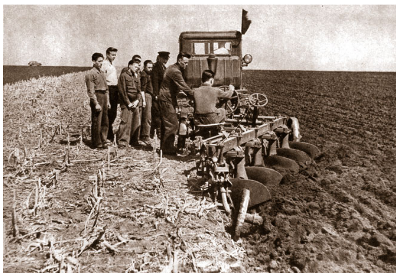
Шкільна виробнича практика, Гадяцький район, Полтавська область