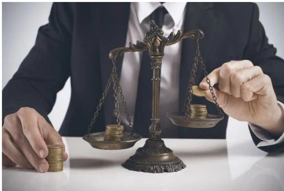
Рахунок 79 «Фінансові результати»

Операція 5. ФІНРЕЗУЛЬТАТ: Доходи (7 клас) – Витрати (9 клас)