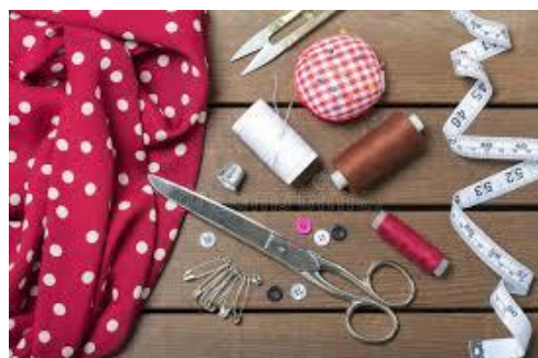
Рахунок 20 «Виробничі запаси»

Операція 2. Далі з куплених тканин і інших матеріалів ви будете шити одяг. В її вартість крім вартості витрачених матеріалів (тканин, ниток, ґудзиків та інших матеріалів) ви повинні будете закласти ще й заробітну плату всіх, хто трудився над її виготовленням, амортизацію обладнання, крім того внесок на загальнообов'язкове державне соціальне страхування (основна ставка ЄСВ 22%).