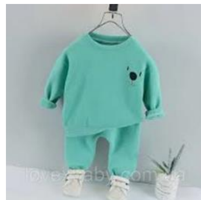
Рахунок 26 «Готова продукція»