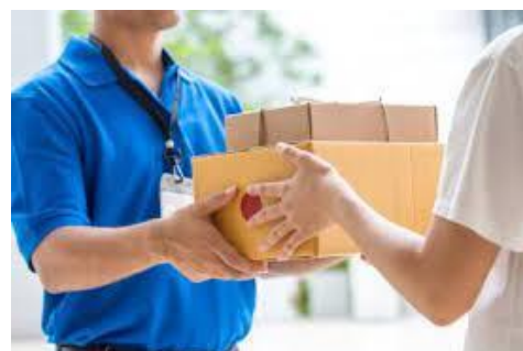
Рахунок 90 «Собівартість реалізації»