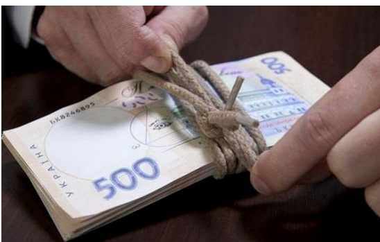
Рахунок 441 «Нерозподілений прибуток»