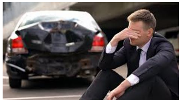
Рахунок 442 «Непокритий збиток »