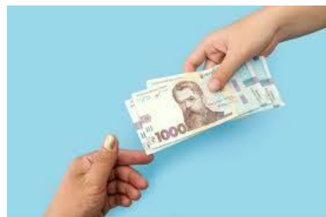
Рахунок 70 «Дохід від реалізації»