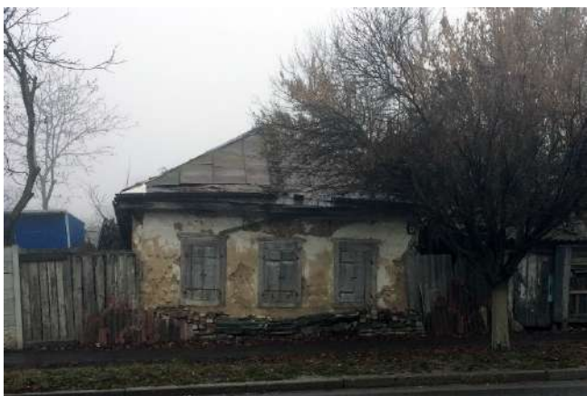
Рис. 1.1. Зміїв, вул. Гагаріна, 37. Фото 2019 р. Хата була побудована 1920 р.