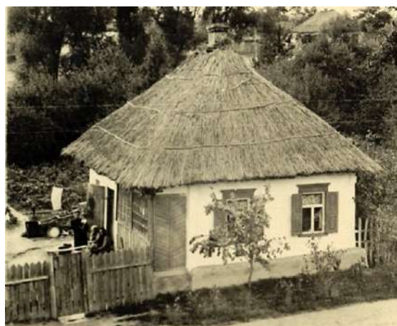
Рис. 1.6. Зміїв, вул. Ковальська. Фото 1953 р.

На межі XIX та XX ст. багато будинків почали обкладатися цеглою (рис. 1.7) або обшивати тесаною дошкою – шалівкою (рис. 1.8), а в якості покрівельного матеріалу відзначається перехід до дерева і заліза [32, с. 129].