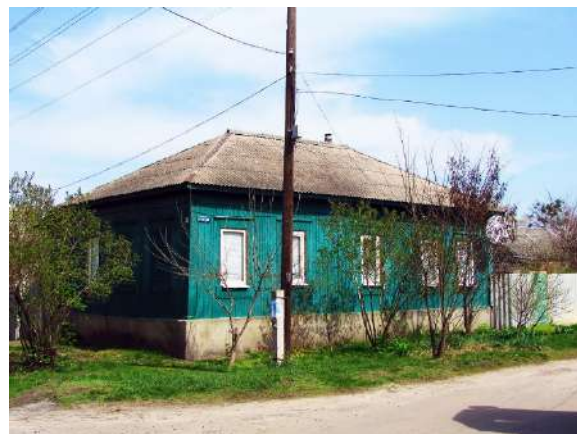
Рис. 1.8. Зміїв, вул. Сизранцева, 32. Фото 2016 р.

Після обвалу цеглової кладки гарно видно зрубний тип будівлі.