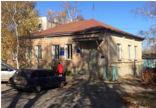
Рис. 1.11. Зміїв, вул. Донецька, 3. Фото 2019 р.