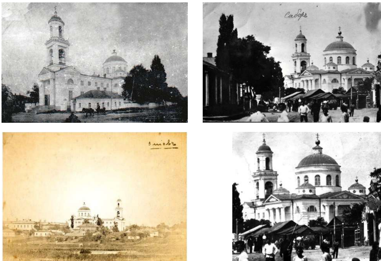
Рис. 3.1. Світлини Свято-Троїцького собору м. Змієва (початок XX ст.)

Часткова руйнація та пограбування Свято-Троїцького собору розпочалася 1918 р. під час другого встановлення радянської влади. Повністю будівлю храму зруйновано 1936 р.