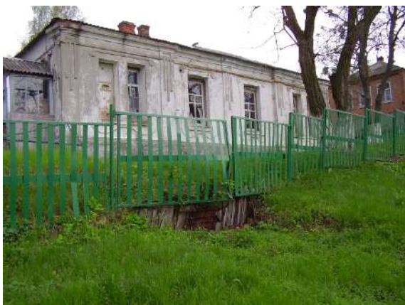
Рис. 1.9. Зміїв, вул. Калініна, 45. Фото 2008 р.

Заможні родини зводили просторі будинки. Так, наприклад, родина Котових на зламі XIX і XX ст. побудувала великий дім по вулиці Зміївській, 6 (рис. 1.10). На початку 1930-х рр. його було націоналізовано та віддано під школу-інтернат для глухонімих дітей. Дім був настільки просторим, що крім класів та кімнат для проживання вихованців, тут були й квартири декількох учителів [1].