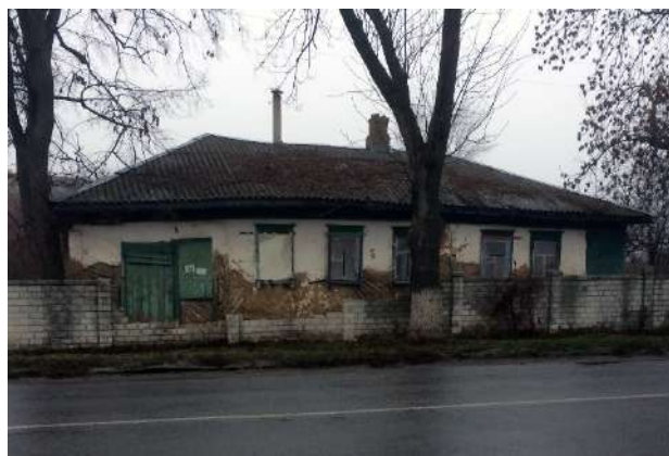
Рис. 1.4. Зміїв, вул. Широнінців, 20. Фото 2019 р.