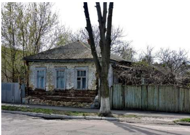
Рис. 1.7. Зміїв, вул. Адміністративна, 19. Фото 2016 р.

На зламі XIX та XX ст. з'являються кам'яні приватні будинки. Звичайно, перш за все, звертає увагу дворянський будинок №45 по вулиці Калініна (рис. 1.9). Побудована в 1910-х рр., вона є в Змієві єдиною спорудою в якій декоративна облямівка вікон була виконана візерунком у стилі модерн [32, с. 129].