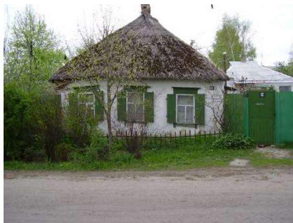
Рис. 1.2. Зміїв, вул. Конституції, 14. Фото 2008 р. Хата була побудована на поч. XX ст., демонтована 2014 р.