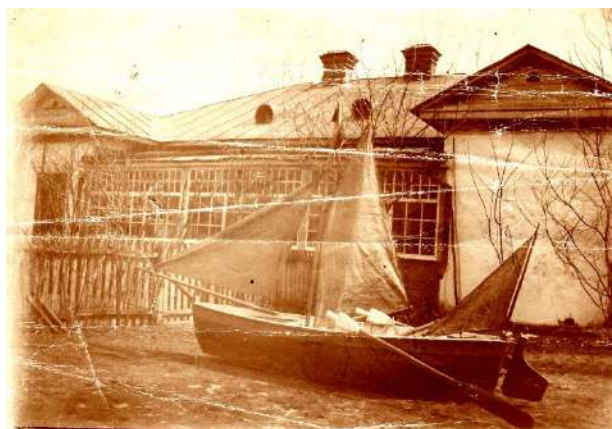
Рис. 1.10. Зміїв, вул. Зміївська, 6. Фото поч. XX ст.

1855 р. напроти Свято-Троїцького собору було побудовано дім для його настоятеля по вулиці Донецькій, 3 (рис. 1.11). 1857 р. було зведено кам'яницю поміщика по вулиці Покровській, (рис. 1.12). 1900 р. на площі Соборній, 9 будується дім купця. Цей будинок був двоповерховим. На першому поверсі розташовувалася крамниця та складські приміщення, на другому мешкала родина купця [28, с. 4-5].