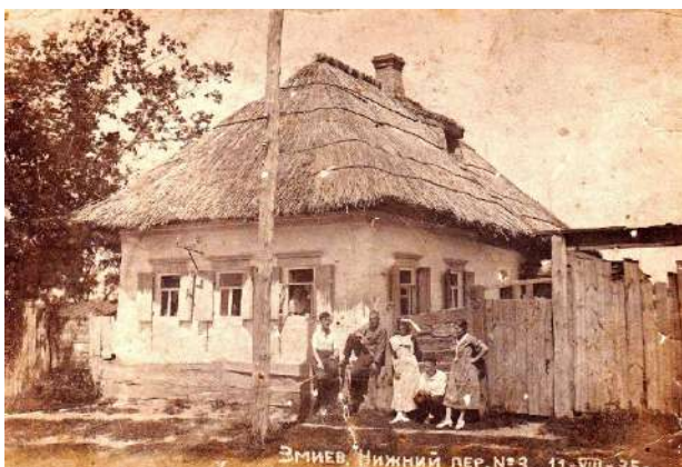
Рис. 1.3. Зміїв, пров. Нижній, 3. Фото 1935 р.