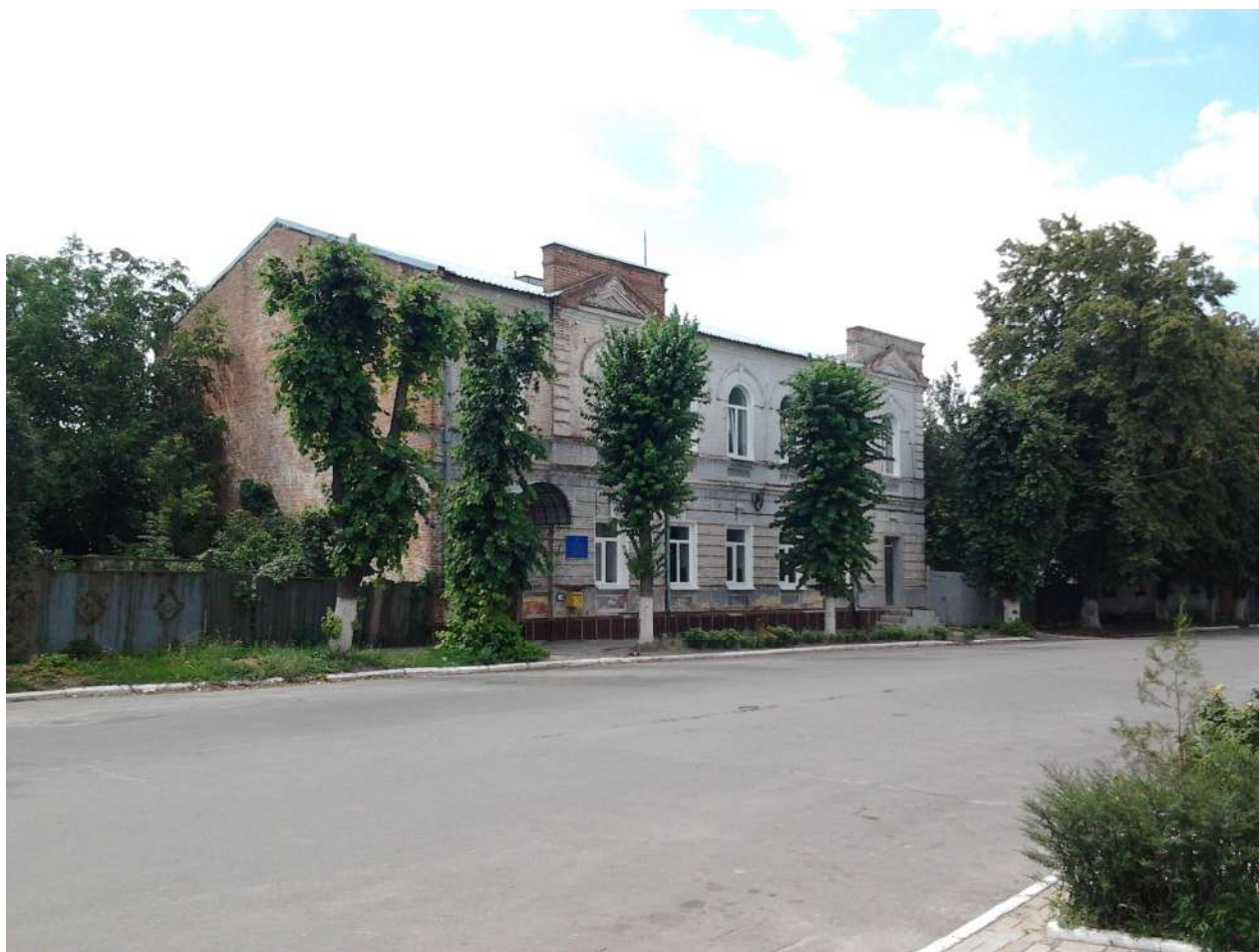
Рис. 2.6. Будівля Зміївського міського громадського Донець-Захаржевського банку (1903 р.)

У другій половині XIX ст. завдяки фінансуванню дійсного статського радника, Почесного громадянина міста Змієва, дійсного члена Російської академії наук Дмитра Андрійовича Донець-Захаржевського було відкрито Зміївський міський громадський банк.