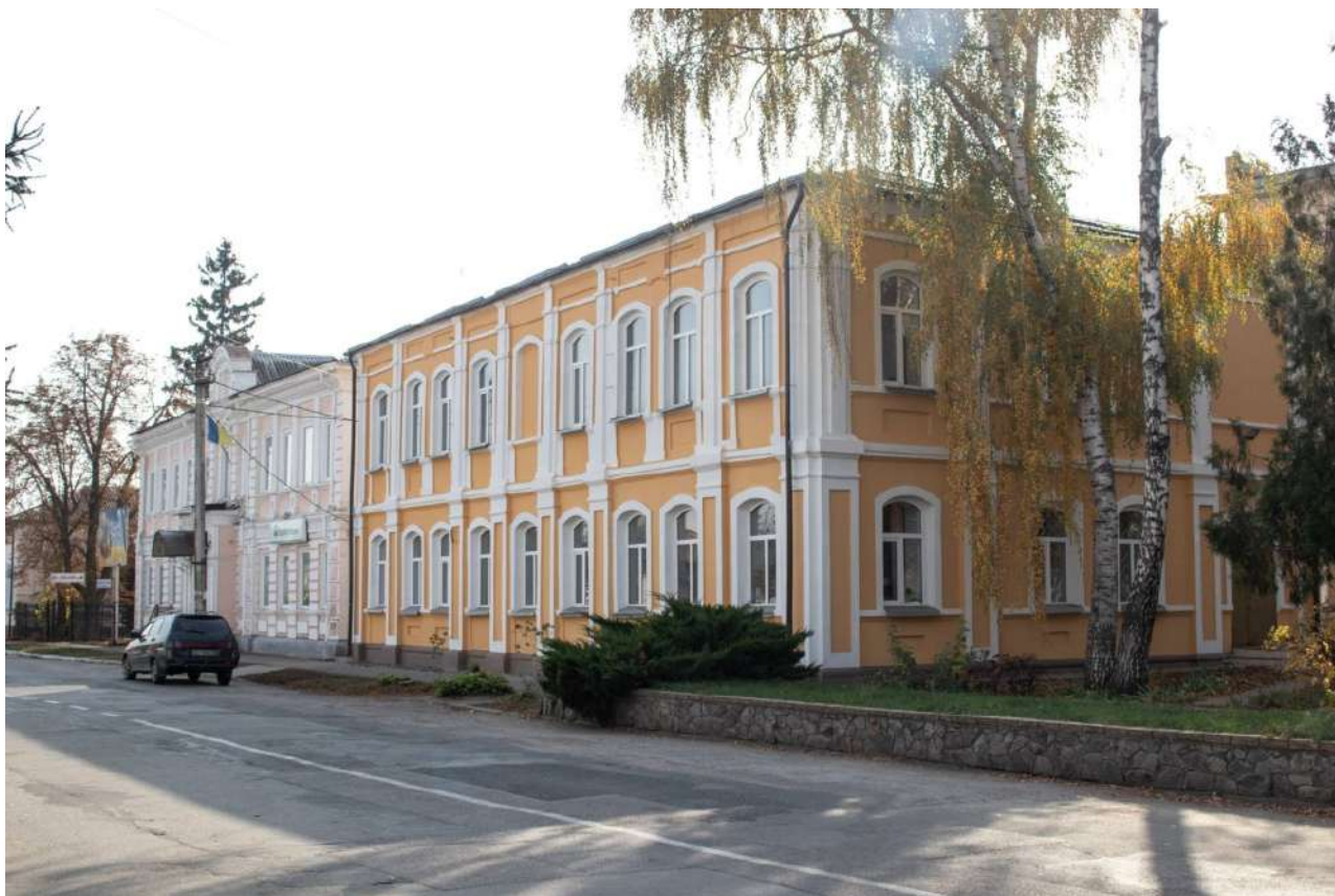
Рис. 2.3. Будівля Зміївської міської лікарні (1911 або 1917 р.)

1 вересня 1968 року було відкрито Зміївську дитячу музичну школу, яка спочатку була розрахована на відвідування 69 учнями по класу скрипки, фортепіано і баяна та розташовувалась на розі вулиці Леніна і Гагаріна. Пізніше школу було переведено у досліджувану нами будівлю. На 1969 р. тут навчалися 171 учень: скрипалів – 19, піаністів і баяністів – по 76 [18].