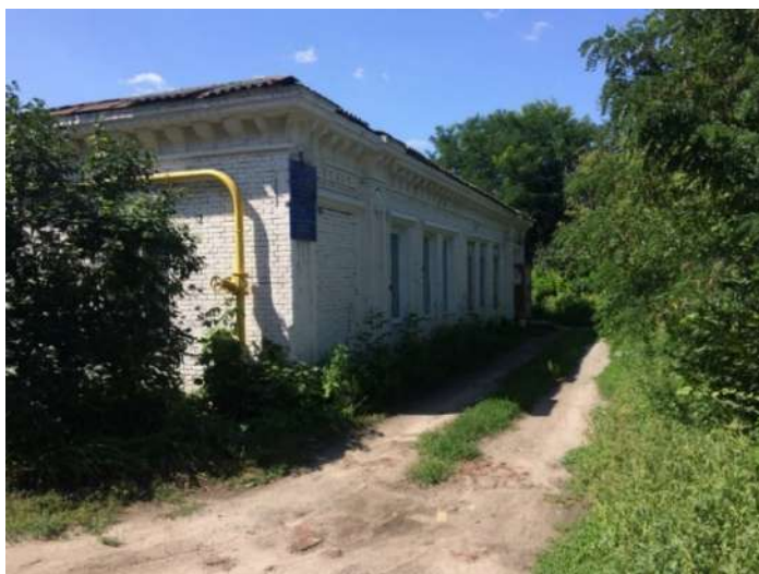
Рис. 2.7. Будівля колишнього Зміївського госпіталю Загальноросійського земського союзу (орієнтовно 1914–1915 рр.)