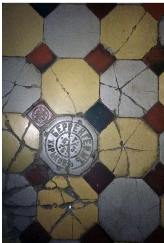
Рис. 2.8. Підлога будівлі колишнього Зміївського госпіталю Загальноросійського земського союзу

Під час вивчення громадських будівель міста Змієва став очевидним різний ступінь збереження первісного архітектурного стилю. Найбільш гарно збереглися будівлі Зміївського Олександрівського ремісничого училища (вулиця Адміністративна, 106) та Зміївського міського громадського Донець-Захаржевського банку (вулиця Адміністративна, 22), найгірше – будівля Зміївського училища (площа