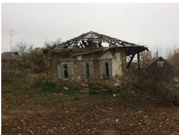
Рис. 1.5. Зміїв, вул. Адміністративна, 38. Фото 2019 р.