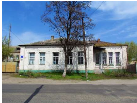
Рис. 1.12. Зміїв, вул. Покровська, 29. Фото 2016 р.

Наводячи підсумки вивчення приватної забудови Змієва середини XIX – початку XX ст., можна зробити наступні висновки. Більша частина міста була забудована традиційними українськими хатами полтавського та слобожанського підтипів центральноукраїнського лівобережного типу. При цьому заможні родини зводили значно більші за розміром хати. Ближче до XX ст. починається процес технічної трансформації (удосконалення житл), у будівництві хат починають вживатися нові матеріали: шальовка, цегла, залізо. Нарешті, верхні прошарки населення будують кам'яні доми.