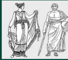
Греки в VII ст. до н.е.

Таким чином, стародавнє різноетнічне населення території нинішньої України пройшло в своєму розвитку всі основні формаційні етапи: кам'яний (палеоліт, мезоліт, неоліт), мідно-кам'яний, бронзовий, ранній залізний віки. Кожний з цих етапів створив свій тип суспільно-господарської організації життя: первісна палеолітична та родова община, племінна структура, класове суспільство. Особливого значення для історичного прогресу цих земель мала епоха античної цивілізації Північного Причорномор'я. Місцеве населення отримало можливість долучитися до передових для свого часу надбань античної цивілізації. Тому не дивно, що ці території історичних зв'язків перейняла згодом Русь-Україна.