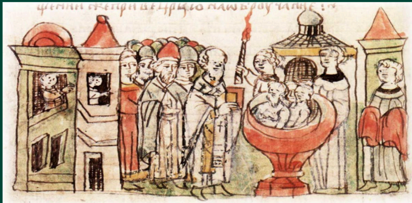
Хрещення Володимира в Корсуні