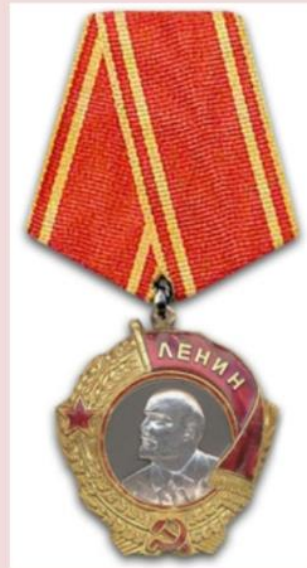
Орден Леніна, 1930 р.