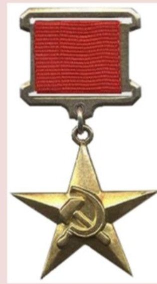
Герой Соціалістичної Праці, 1938 р.