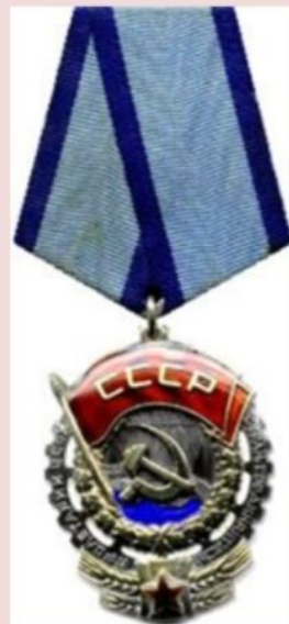
Орден Трудового Червоного Прапора, 1928 р.