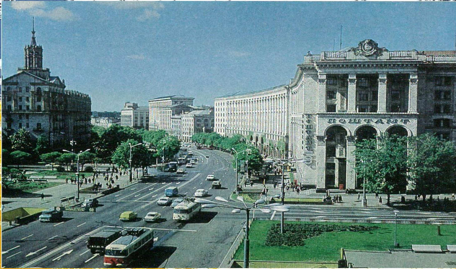
Хрещатик (1977 р.)

Найкрасивіша вулиця Києва – Хрещатик. Широкий, просторий. Це центральна вулиця Києва.