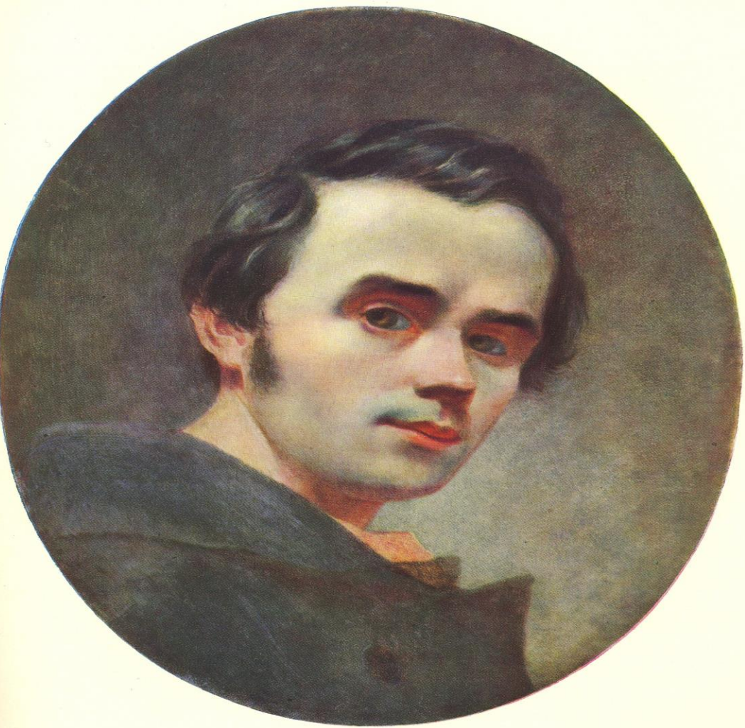
28. АВТОПОРТРЕТ. Олія. [Зима 1840—1841].