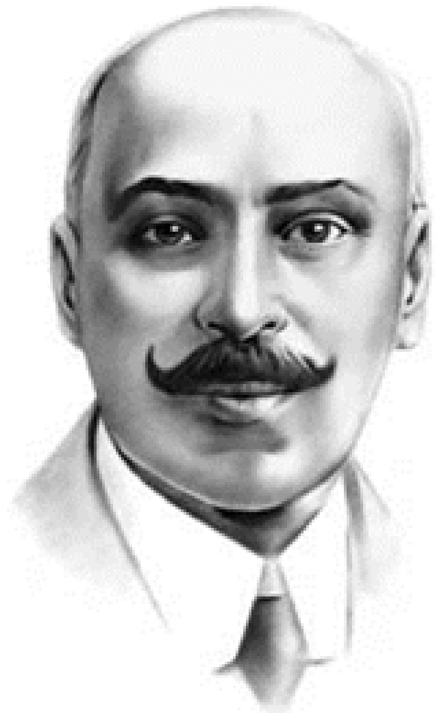
Михайло Коцюбинський (1864—1913)