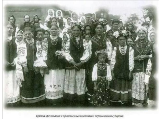
Фото. Українці, 1867 рік