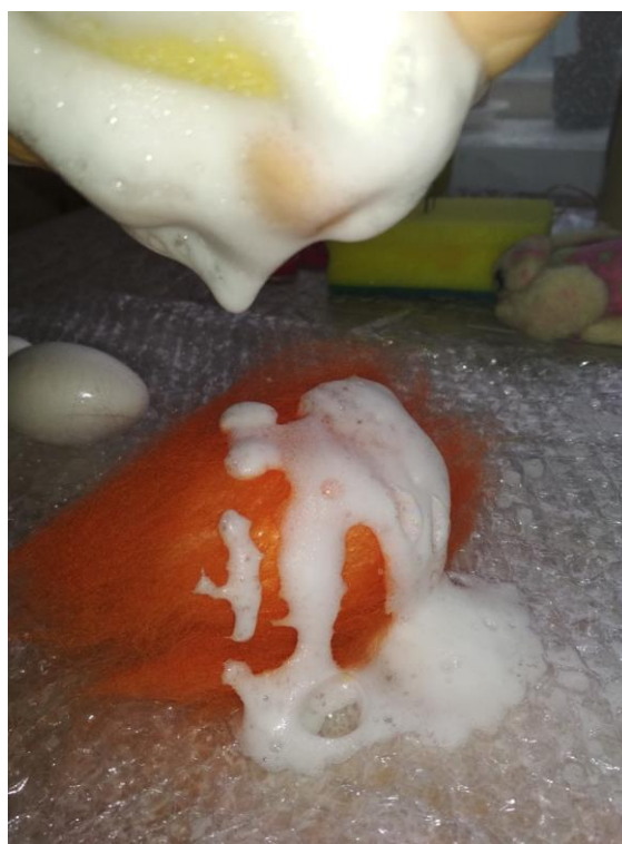
Рис. 3 – Фото кроку 3