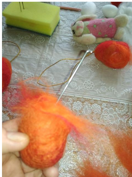
Рис. 9 – Фото кроку 11

Крок 11. Фільцуємо виріб у місці розрізу. Для цього голкою № 32 прибиваємо пасма до поверхні наповнювача (Рис. 9). Завдання цього етапу - всі кінці пасм заправити всередину виробу. Дана вправа підходить тому, хто вперше займається фільцюванням, адже тренує найпримітивнішу техніку роботи голкою.