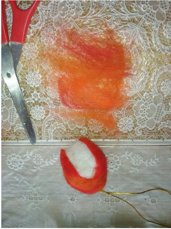
Рис. 8 а