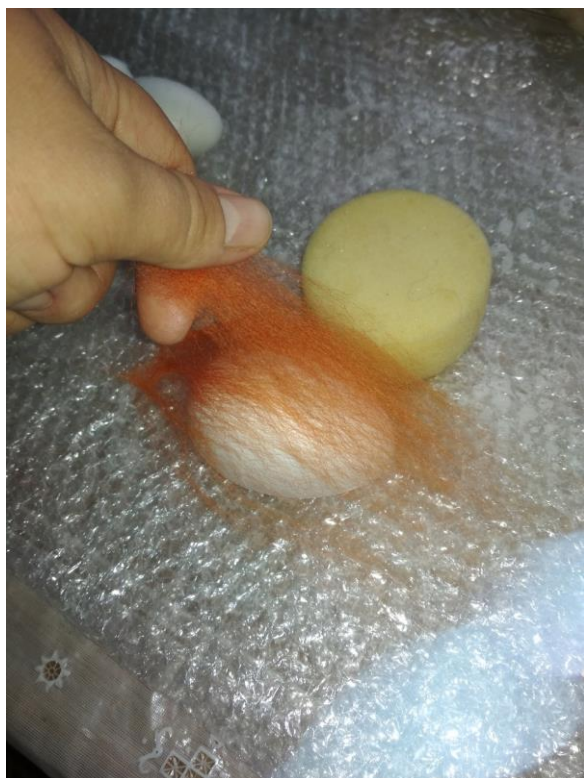
Рис. 2 – Фото кроку 2