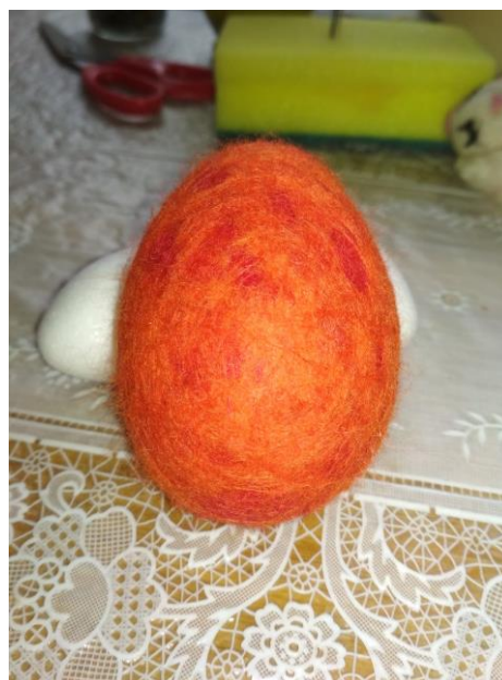
Рис. 5 – Фото кроку 5

Крок 6. Вимиваємо мильний розчин з войлоку під струменем прохолодної води з крану. Вибираємо зайву вологу серветкою і лишаємо просушуватися до наступного заняття.