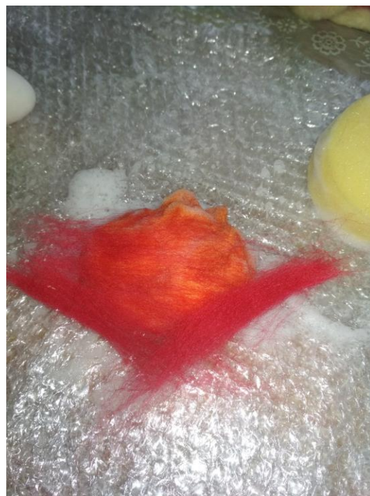
Рис. 4 – Фото кроку 4