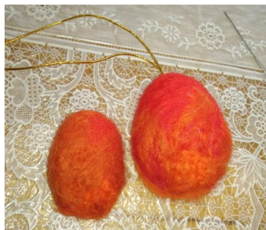
Рис. 10 – Фото завершального етапу виготовлення виробу «Войлочна крашанка»

Крок 13. Перетворюємо крашанку на писанку. Для цього відщипуємо тонке довге пасмо білої довгорунної вовни і викладаємо основні лінії писанки, наприклад, меридіани (Рис. 11 а). Починаючи з місць пересікання білих ліній, спіралевидною голкою № 38 привалюємо білу вовну (Рис. 11б). Товщину ліній регулюємо густиотою проколів - чим їх більше, тим тонша лінія вийде (Рис. 11 в).