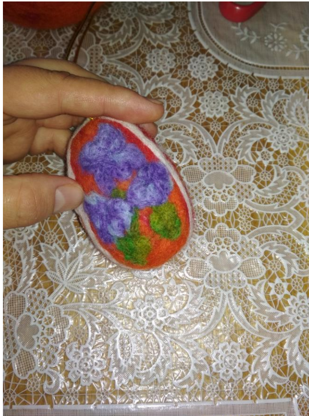
Рис. 12 – Фото кроку 15

Крок 15. Кольоровою вовною і голкою №38 можна формувати традиційні чи сучасні художні образи: квіти, колоски, лозу, веселку тощо (Рис. 12).