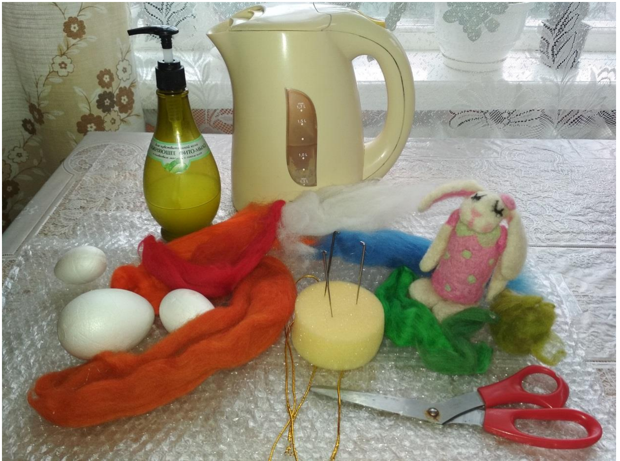
Рис. 1 – Матеріали, інструменти, пристосування для валяння

Урок 1. Виготовлення войлоку у техніці мокрого валяння (фелтінгу) з натуральної вовни (Час 45 хв).